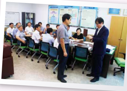
2014년도 도정역점시책 우수 부서 수상(도지사) - 보건환경연구원 연구부(공로패 및 시상금 300만원)