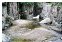
〈포항시 보경사 계곡〉

~3.9mg/L, 총 유기탄소(TOC)는 0.7~3.0mg/L, 과망간산칼륨 (KMnO 4 ) 소비량은 2.1~7.3mg/L, 대장균은 500CFU/100mL 이하로 조사대상인 20개소 자연유원지 물놀이 시설의 수질은 생활 환경 수질기준 1등급으로 매우 위생적인 수질상태를 유지하는 것으로 나타났다.