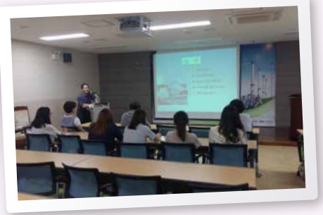
2015년 하반기 기간제근로자 소양교육 실시