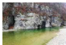
〈영덕군 옥계 계곡〉