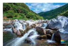
〈청도군 삼계리 계곡〉