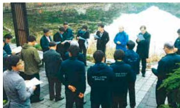
(수질오염사고 발생 시 신속대응팀 현장회의(포항시 소재 마장지) 참석)

저니 오염도 관련 실태조사 등이었다.(표) 이러한 사고와 민원에 대한 신속한 대응은 평상시 연구원에 수립되어 있는 비상대응 분석체계 시스템과 연구원 신속대응팀과 분석관련 유