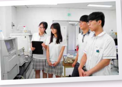
북부지원 수질분석 현장 체험(경북봉화고등학교) - 봉화고등학교 과학동아리