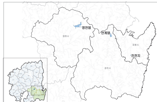
Fig. 1. Location of study area

측정항목으로는 남조류독소인 Microcystin 8종(-LR, -RR, -YR, -LA, -LF, -LY, -LW, -WR), nodularin 및 cylindrospermopsin으로 총 10종을 액체크로마토그래프-텐덤질량분석