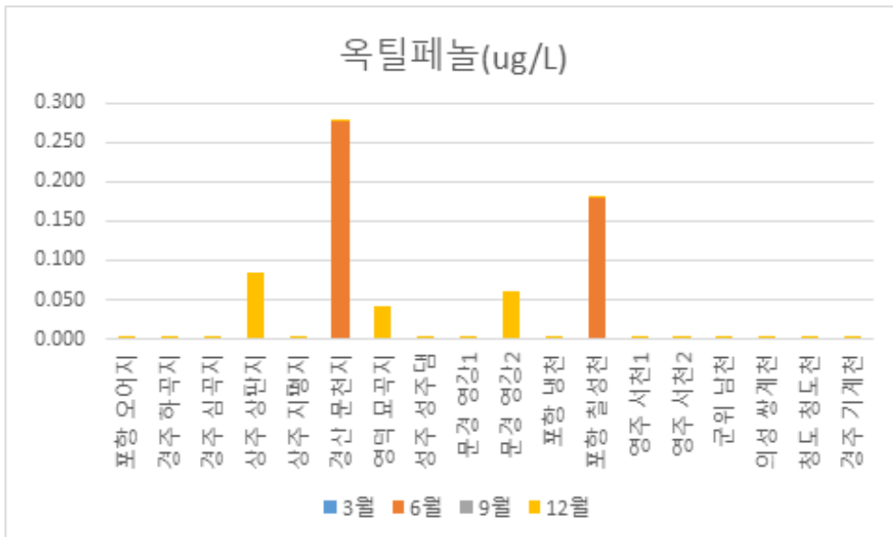
Figure 2. Characteristics of Octylphenol Detection in River and Lake