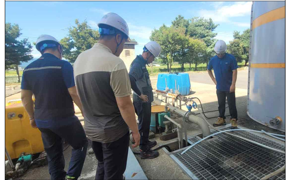
하수처리장 시설물 공동점검