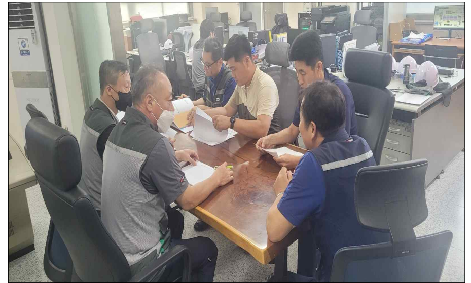
민·관 통합 시설운영팀 오전 회의